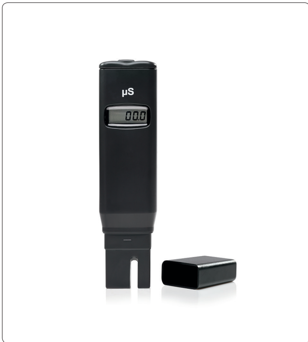
MELAtest® 60 inkl. Schutzkappe