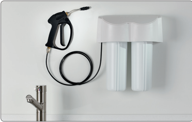
MELAJet® an MELAdem® 40 installiert