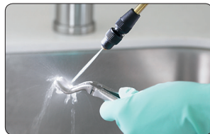
Abb.rechts: MELAJet® mit Punktstrahl