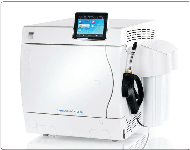
Vacuklav® 40 B+ mit MELAdem® 40 und MELAJet® Sprühpietole