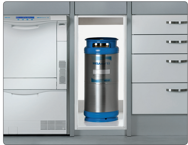
MELAdem® 53 in einem Unterschrank montiert