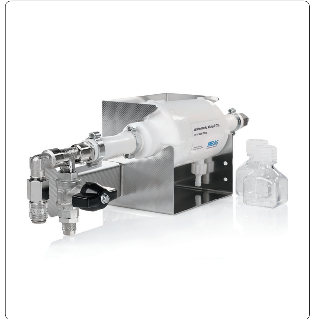
Bakterienfilter inkl. Wandhalterung und Laborflaschen