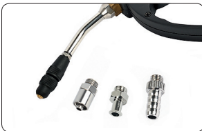
Abb.links: MELAJet® mit individuellen Aufsätzen