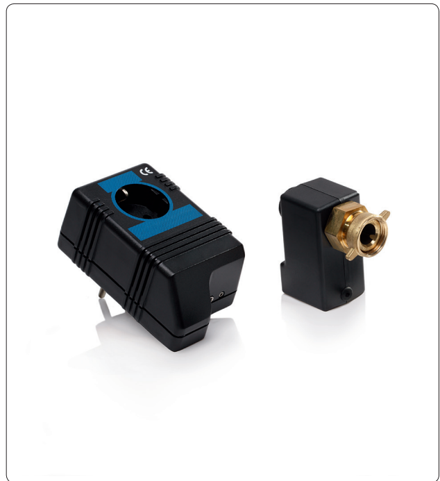
Wasserstopp bestehend aus Steuergerät (links) und Magnetventil (rechts)