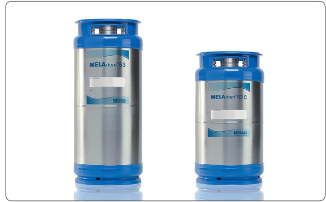
MELAdem® 53 und MELAdem® 53 C