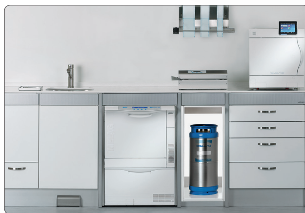
Alles aus einer Hand – Lösungen für die Hygienekette

Bei der Instrumentenaufbereitung in der Arzt- und Zahnarztpraxis ist hochwertiges und sauberes, demineralisiertes oder destilliertes Wasser besonders wichtig. Dieses Wasser wird aus Trink- bzw. Leitungswasser gewonnen, das von Natur aus viele Mineralien enthält und daher aufbereitet werden muss. Eine mindere Wasserqualität führt zu Ablagerung von Wasserinhaltsstoffen, wie beispielsweise Calciumcarbonat, auf den Instrumenten und in der Kammer des Autoklaven und beschleunigt deren Verschleiß: Bereits ab einem Leitwert von ca. 30 \mu\text{S}/\text{cm} können Verfärbungen oder Rost auf den Instrumenten entstehen. Nur die Verwendung von demineralisiertem Wasser gewährleistet den optimalen Werterhalt des Autoklaven und den Schutz Ihrer Instrumente.