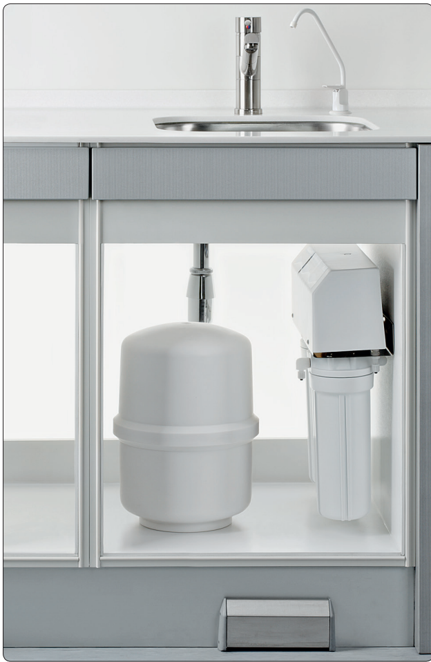
MELAdem®47 mit Entnahmehahn und Vorratsbehälter in einem Unterschrank montiert