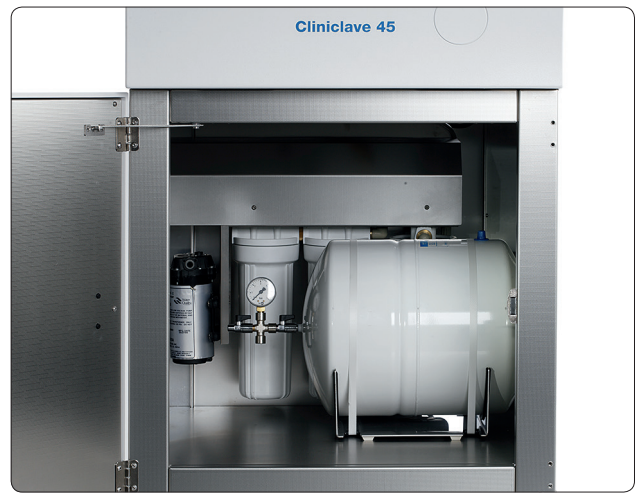
MELAdem®56 mit Vorratsbehälter montiert in einem Unterschrank des Cliniclave®45