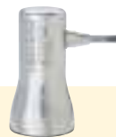
Niethammer mit Meißelaufsatz