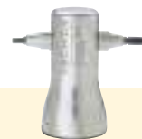
Doppelniet- hammer DNH