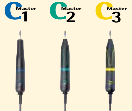
Motorhandstück Art.-Nr. 3500 Art.-Nr. 6600 Art.-Nr. 7050