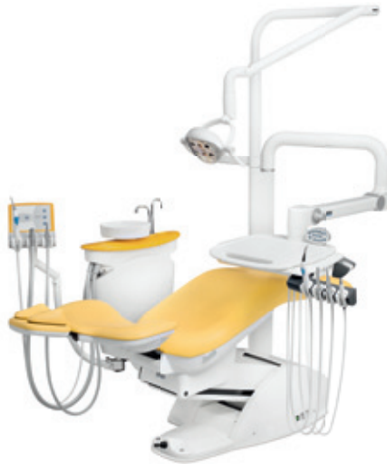
easy KFO 2