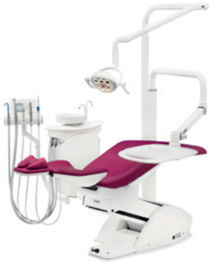
easy KFO 1