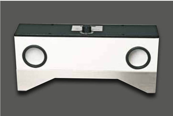
Absaugtraverse für 2 Poliertröge, inkl. Luftweiche und einem Ausgangsstutzen für eine externe Absauganlage