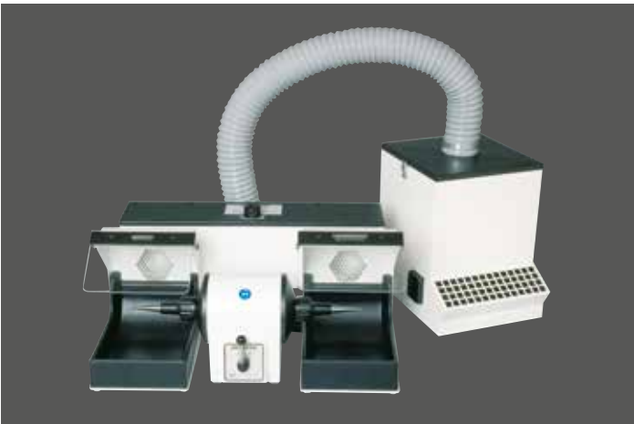
WSM-2 mit Zubehör und Niederdruck-Absauganlage SG-1/1