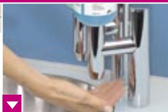
Berührungsfreie Bedienung über Infrarot Sensoren – ohne Nach-tropfen