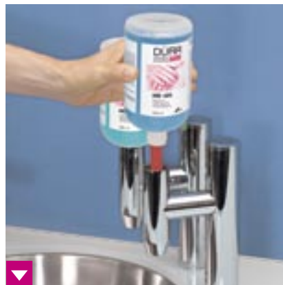
Einwegflaschen HD 410/HD 425 mit Pumpe kopfüber auf den Hygocare Sensor stecken