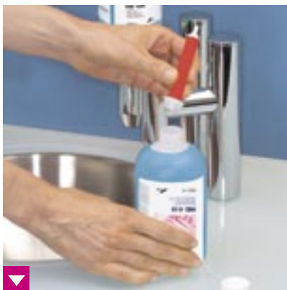
Mitgelieferte Einwegpumpe auf HD 410/HD 425 aufsetzen und fixieren