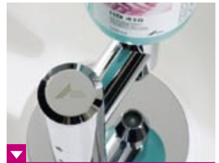
Elegant und hochwertig passt der Dürr Hygocare Sensor in jedes Praxisumfeld