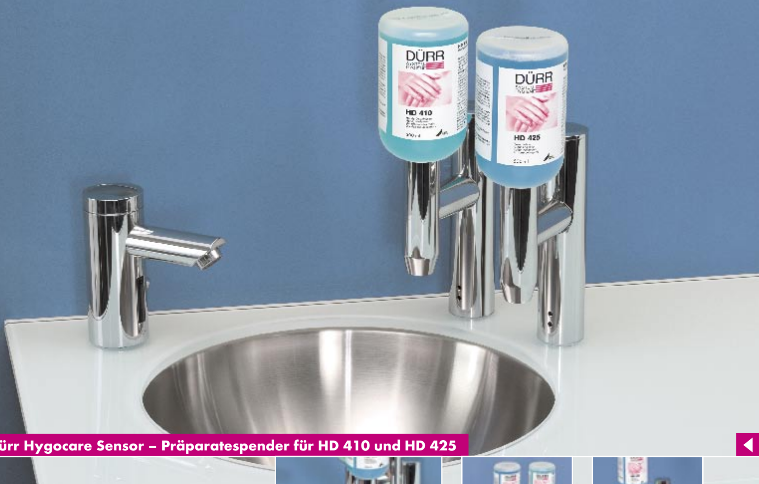
Dür Hygocare Sensor – Präparatespender für HD 410 und HD 425