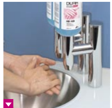
Berührungsfreie Dürr Händedesinfektion und -reinigung wie vom RKI empfohlen

DÜRR DENTAL AG Höpfigheimer Strasse 17 74321 Bietigheim-Bissingen Germany