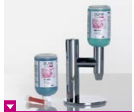
Dürr Hygocare Sensor mit Dürr HD 410 und HD 425 in den 500-ml-Einwegflaschen

Der innovative Dürr Hygocare Sensor ist die perfekte Lösung für das Händedesinfektionsmittel HD 410 und die schonende Waschlotion HD 425 aus der Dürr System-Hygiene. Sie gewährleisten eine einwandfreie Desinfektionswirkung bzw. geben der Haut gleichzeitig Schutz und Pflege. So wird das Risiko von Unverträglichkeiten, Irritationen oder Allergien minimiert. Die Infrarot-Steuerung ohne Nachtropfen entnimmt dem Hygocare Sensor nur die exakt gewünschte Menge, was eine Überdosierung vermeidet.